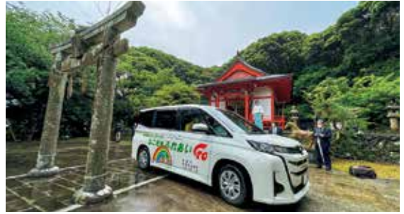
安全祈願祭を終えた「はこぎふれあいGO」

6月2日(金)箱崎八幡神社にて、箱崎地区まちづくり協議会が運行するコミュニティーバス「はこぎふれあいGO」の運行安全祈願祭と、運行出発式が開催されました。市内では初山地区に運行している「オレンジバス」に続き2例目。完全予約制で自宅から乗車することができ、料金は70歳以上100円、70歳未満200円。商店や病院、郵便局などへ移動手段を持たない高齢者等の足として活躍します。